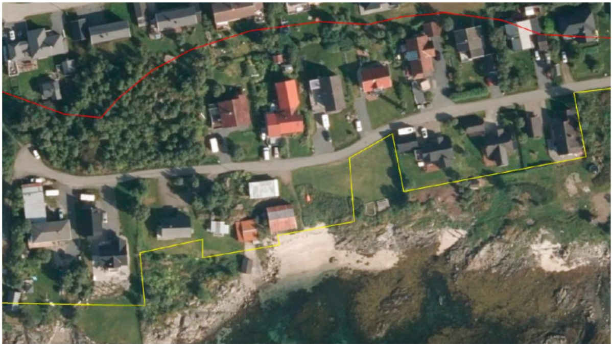
Figur 6: Kartutsnitt med funksjonell strandsone (gul linje) og 100-metersbeltet (rød linje) slik kommunen foreslår i foreløpig utkast av kommuneplanens arealdel.

Her står det skrevet under bildet i søknaden at dette er forslaget til ny funksjonell strandsone slik kommunen foreslår se bilde