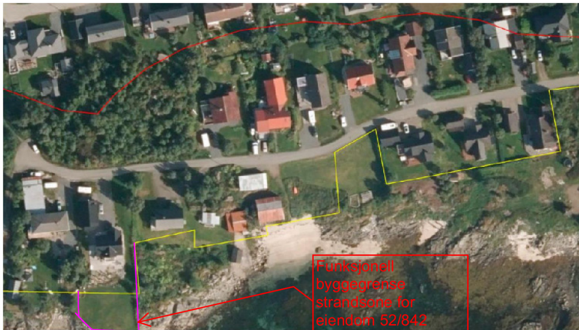
Figur 6: Kartutsnitt med funksjonell strandsone (gul linje) og 100-metersbeltet (rød linje) slik kommunen foreslår i foreløpig utkast av kommuneplanens arealdel.

Da dette er et bilde som er brukt i en plansøknad, kan ikke vi forholde oss til dette da dette ikke er tatt med i denne høringen, vi har derfor for å få klarhet i dette tegnet funksjonell strandsone grense inn på bildet for vår eiendom slik den fremgår av vedlegg Plankart-4-utsnitt- Melbu i høringsutkastet. Se skisse