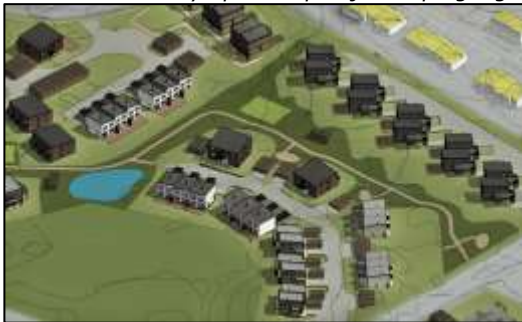
Vestbakken boligområde ved Stokmarknes. Illustrasjon: Asplan Viak AS

Nye private prosjekter på gang som støtter opp om det boligsosiale arbeidet: