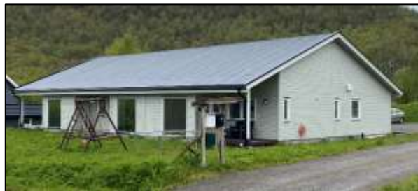
«Leie til eie» prosjekt i Stokmarknes

Den kommunale planstrategien 4 sier at vi skal revidere strategisk boligplan i 2023, så det hersker ingen tvil om at kommunestyret ønsker slik innsats videre. Hva angår framtidig planstrategi står det i den nye loven at denne også skal avgi en status på det boligsosiale området.