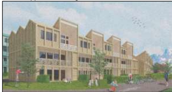
Børøya sør boligområde «Måken» på Børøya Illustrasjon: Creamos as/ C.F. Møller Norge AS