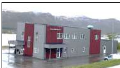
Hadsel eiendom KF sine lokaler på Børøya

De med behov for bolig tar ofte kontakt med ulike instanser i kommunen, og derfor koordineres en god del av disse forespørslene i jevnlig tverrfaglige bolig møter. Hadsel eiendom KF forvalter kommunale utleieboliger, og innkaller jevnlig til bolig møtene der NAV, flykningetjenesten, tjenestekontoret og evt. andre aktuelle deltar. I disse møtene blir bl.a. tildeling av kommunale leieboliger diskutert, så også andre løsninger i det ordinære markedet. Det er behovet og ikke hvor lenge du har stått på lista som er først og fremst avgjørende. Bolig møtene vil bli enda mer sentrale i fremtiden i forhold til oppfølging av den nye loven.