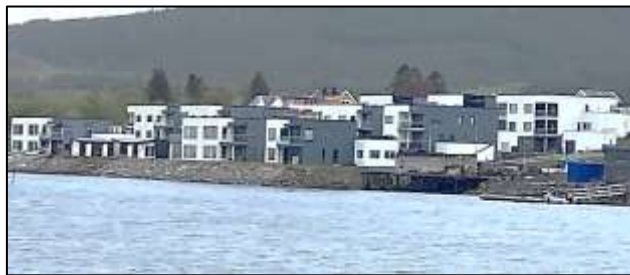
Privat utbyggingsprosjekt på Søndre der Hadsel eiendom KF har kjøpt seg inn

Noen har utfordringer som gjør det vanskelig å bo. Dette må naturlig nok bli prioritert i ny plan.