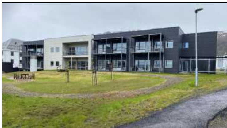
Heldøgns-bemannede kommunale omsorgsboliger på Stokmarknes.