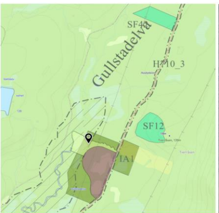
Utklipp reguleringsplan og kommuneplan